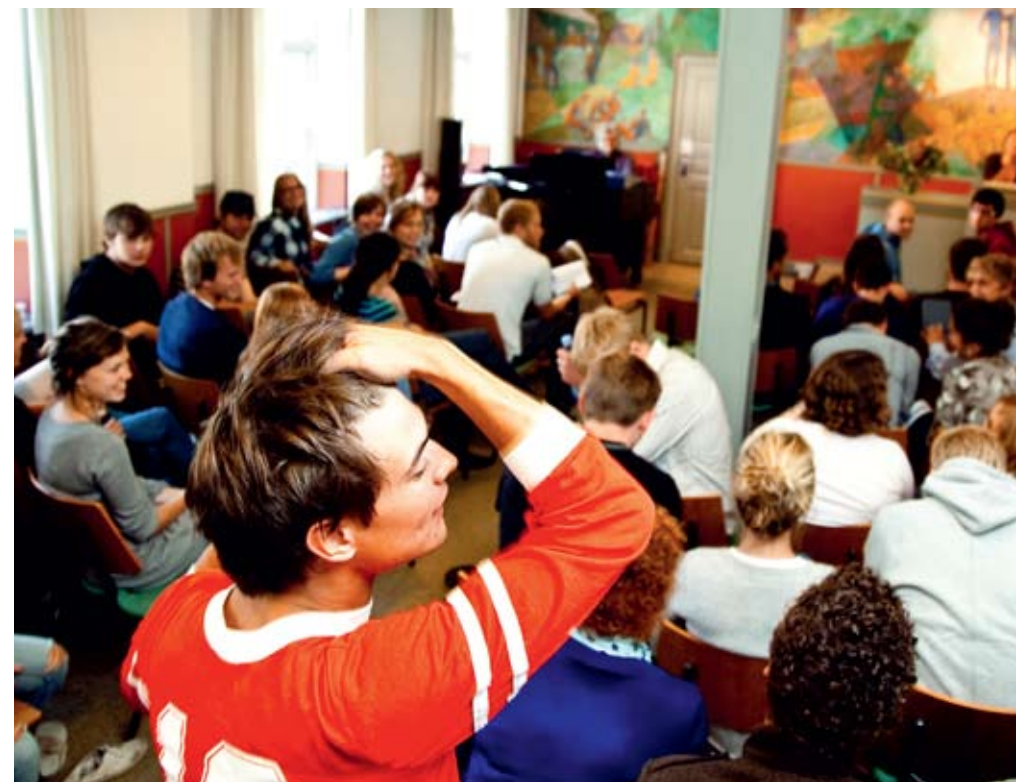
Formen kan være afslappet, men indholdet i undervisningen er på et højt niveau.

> bedre brobygning, og så er vi blevet mere synlige i det århusianske uddannelsesbillede, konstaterer hun.